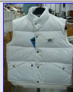
Piumino smanicato Down Vest Vintage